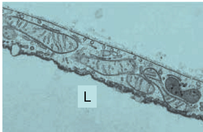
Figura 1 – Particolare del sottile citoplasma di adipocita bianco visto al microscopio elettronico a trasmissione (circa 15000x). Si noti la presenza di mitocondri allungati con creste variamente orientate. L: goccia lipidica. Da (18).

bisogno continuo di energia per la normale sopravvivenza e quindi risulta necessario un sistema che consenta un temporaneo accumulo di energia e una lenta e continua distribuzione della stessa. La forma sferica di queste cellule è quella che geometricamente consente il massimo volume nel minimo spazio. Quando l'intervallo di tempo che intercorre tra un pasto e l'altro raggiunge l'ordine delle settimane il tessuto adiposo bianco assume l'importanza di un organo vitale. Per questo motivo nelle migliaia di secoli che hanno preceduto l'attuale abbondanza di cibo si sono selezionati i geni che consentono una rapida capacità di sviluppo del tessuto adiposo bianco. Forse questo è uno dei motivi della attuale diffusione epidemica dell'obesità.