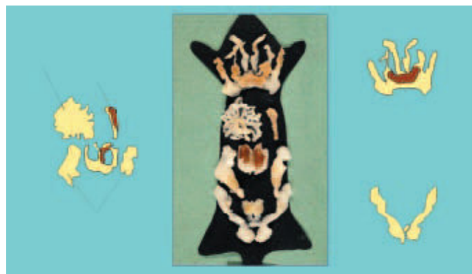
Figura 3 – Organo adiposo di topo adulto magro mantenuto a condizioni standard. I depositi sono stati disseccati e posizionati su una sagoma per dimostrarne la posizione anatomica. Le parti otticamente brune sono evidenziate in marrone. Da (18).